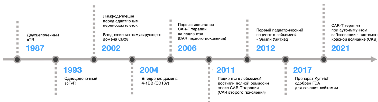
Рисунок 2 | Таймлайн развития CAR-T-клеточной терапии. Адаптировано из Mitra A. et al. From bench to bedside: the history and progress of CAR T cell therapy // Frontiers in Immunology. 2023. Vol. 14.[22].